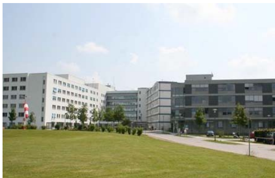
Der Freistaat unterstützt die Krankenhäuser in Schwaben finanziell, um die stationäre medizinische Versorgung auf einem zeitgemäßen Stand zu halten.

Eine gute stationäre, wohnortnahe Patientenversorgung ist ein Pfeiler des bayerischen Gesundheitssystems. Bayern stellt im Doppelhaushalt 2009/ 2010 500 Millionen Euro für die Krankenhausfinanzierung bereit. Damit wird nicht nur die Versorgung der Menschen in Bayern weiter verbessert, sondern gleichzeitig ein kräftiger An Schub für Bauwirtschaft, Handwerk und medizintechnische Industrie geleistet. Insgesamt hat der Freistaat die Krankenhäuser in ganz Schwaben in den vergangenen fünf Jahren mit rund 348 Millionen Euro gefördert. Damit konnten zahlreiche Bauprojekte auf den Weg gebracht und die medizintechnische und allgemeine Ausstattung der Krankenhäuser auf einem zeitgemäßen Stand gehalten werden.