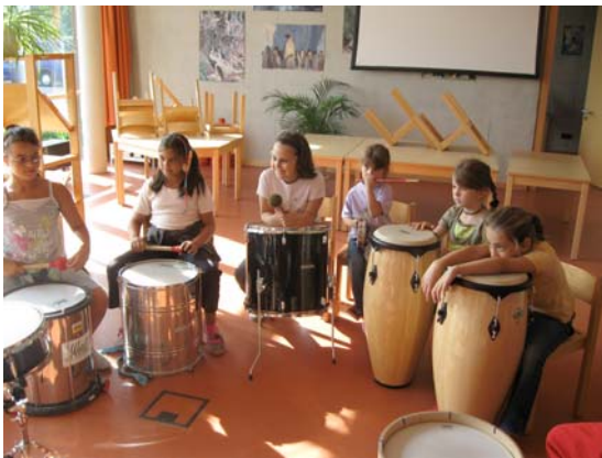
Der Kinderhort im Bildungshaus 3-Auen-Schule in Augsburg-Oberhausen hat 60 Plätze und bietet eine Mittagsbetreuung an.

Familien und Kinder sind unsere Zukunft. Geborgenheit, Sicherheit und kulturelle Identität wachsen zuallererst in den Familien. Ein guter Start ins Leben hängt von der Familie ab. Deshalb ist der Bayerischen Staatsregierung Familienpolitik so wichtig. Wir wollen, dass Bayern das familienfreundlichste Land Europas wird. Dabei gilt: Wir fördern Familien, aber bevormunden sie nicht. Wir stützen Familien, aber schreiben ihnen nichts vor. Das ist Wahlfreiheit. Und zur Wahlfreiheit gehört einerseits das Landeserziehungsgeld und andererseits der konsequente Ausbau der Kinderbetreuung – gemeinsam mit den Kommunen. Unser Ziel heißt: Wir schaffen bis zum Jahr 2012 in Bayern ein verlässliches und bedarfsgerechtes Betreuungsangebot für Kinder von ein bis 14 Jahren.