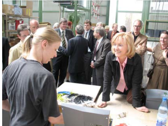
Staatsministerin Dr. Beate Merk informiert sich vor Ort über die Sicherheit und die aktuelle Situation der Justizvollzugsanstalt Aichach.