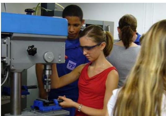
Aktionstage für Schüler, beispielsweise bei den Vereinigten Papierwerken, bieten gerade für Mädchen Chancen, technische Berufsfelder kennenzulernen.

Die Wirtschaft in Bayern wächst weit überdurchschnittlich, die Arbeitslosigkeit im Freistaat ist deutlich unterdurchschnittlich. Das schafft Bayerns Bürgerinnen und Bürgern einen höheren Lebensstandard und gute Arbeit. Motor dieser Dynamik ist die richtige Mischung aus starken international tätigen Unternehmen, einem leistungsfähigen Mittelstand, Handwerk und Freien Berufen, eine hohe Innovationskraft durch exzellente Bildung und Forschung, eine gute Infrastruktur und eine Regionalpolitik mit dem Ziel gleichwertiger Lebensbedingungen im ganzen Land. Erfreulich ist: Bayern hat sich auch gegenüber den Auswirkungen der derzeitigen Wirtschaftskrise äußerst robust gezeigt. Der Freistaat konnte im Jahr 2009 mit einer Arbeitslosenquote von 4,8 Prozent (deutschlandweit: 8,2 Prozent) nach wie vor bundesweit die beste Arbeitsmarktsituation aufweisen – weitaus besser als befürchtet. Auch Schwaben steht im Jahresdurchschnitt 2009 mit 4,6 Prozent in Bayern und auch im deutschlandweiten Vergleich gut da.