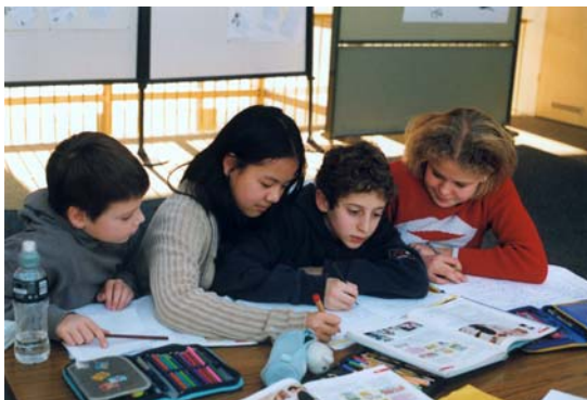
Gemeinsam lernen macht Spaß und bildet: Bei internationalen Vergleichsstudien schneiden bayerische Schüler regelmäßig hervorragend ab.

Bildung ist der Schlüssel für den Start ins Berufsleben und in die Gesellschaft. Es ist ein großer Erfolg, dass Bayerns Schüler bei internationalen Vergleichsstudien regelmäßig hervorragend abschneiden. Die bayerische Bildungspolitik setzt auf eine umfassende Persönlichkeitsentwicklung, auf individuelle Förderung, auf Wissen, Können und Werte. Wesentlich ist dabei die Durchlässigkeit des Bildungssystems. Tragende Elemente bayerischer Bildungspolitik sind bessere vorschulische Betreuung, mehr Ganztagsangebots in allen Schularten und kleinere Klassen sowie Selbstständigkeit der Schulen und neue Kooperationsmodelle.