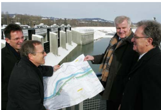
Ministerpräsident Horst Seehofer (2. v. r.) informiert sich bei einem Schwabenbesuch über das Hochwasserschutzprojekt Obere Iller. Das Projekt ist das größte Hochwasserschutzprojekt in ganz Bayern.

Eine gesunde Umwelt ist ein wichtiger Teil der hohen Lebensqualität und Attraktivität Bayerns. Die Bewahrung der Schöpfung ist Verpflichtung gegenüber kommenden Generationen. Deshalb haben Klima- und Umweltschutz in Bayern einen hohen Stellenwert. Bayern hat einen um ein Drittel niedrigeren Ausstoß von CO 2 pro Kopf als im Bundesdurchschnitt, einen hohen Anteil an regenerativen Energien, eine hervorragende Trinkwasserqualität, saubere Flüsse und Seen. Ein Markenzeichen ist der erste Umweltpakt Deutschlands, an dem sich mittlerweile über 5.500 Unternehmen beteiligen. Mit dem Klimaprogramm Bayern 2020 setzt sich die Bayerische Staatsregierung ehrgeizige Klimaschutzziele. Bayern soll auch in Zukunft Vorreiter sein bei der Bewahrung der Schöpfung. Ökologie und Ökonomie gehen in Bayern Hand in Hand, denn wir betrachten Klimaschutz und Umweltschutz nicht als Job-Killer, sondern als Job-Motor.