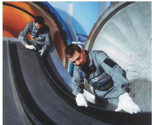
In der Luft- und Raumfahrt werden leichte Faserverbundwerkstoff häufig verarbeitet, da sie den Treibstoffverbrauch und somit die Emission von Schadstoffen verringern