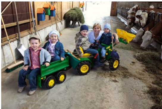
Urlaub auf dem Bauernhof ist gerade für Eltern mit Kindern ein spannendes Erlebnis mit Einblicken in den Alltag der Landwirtschaft mit Natur und Tieren.

Bayerns Land- und Forstwirte prägen unsere Kultur, Wirtschaft und Landschaft im ländlichen Raum. Die bayerischen Familienbetriebe geben unserem Land eine besondere Lebensqualität und gehören zur Stärke und zur Seele Bayerns. Die Bayerische Staatsregierung unterstützt eine leistungsfähige bäuerliche Land- und naturnahe Forstwirtschaft. Wir setzen uns ein für Versorgungssicherheit, auskömmliche Preise und Einkommen sowie Planungssicherheit für unsere Landwirte. Konventionelle und ökologische Landwirtschaft, regionale Versorgung und Produktion für den internationalen Markt werden gleichwertig gefördert. In Bayern haben Land- und Forstwirte eine gute Zukunft.