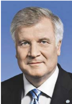
Horst Seehofer Bayerischer Ministerpräsident

Die Bayerische Staatsregierung unterstützt in vielfältiger Weise die positive Entwicklung in Schwaben, dem zweitgrößten Regierungsbezirk Bayerns. Diese Broschüre trägt – ohne jeden Anspruch auf Vollständigkeit – Beispiele für dieses Engagement zusammen.