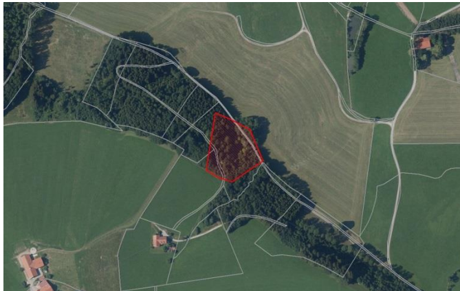
Luftbildausschnitte 1:2.500 Quellflur bei Staig