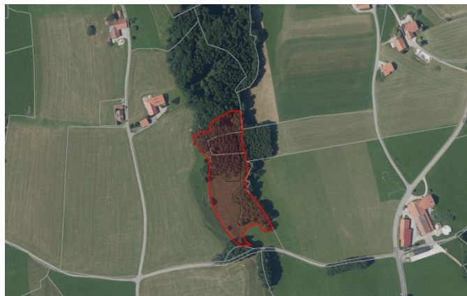
Hangquellmoor westlich Maisenbaindt