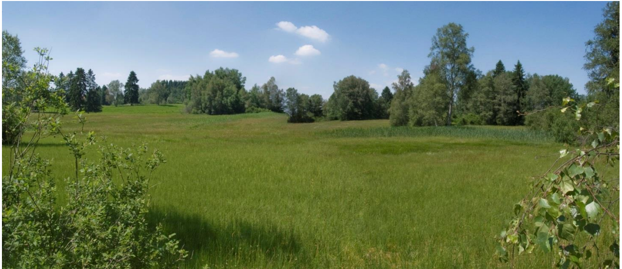
Überblick Lindenberger Moos