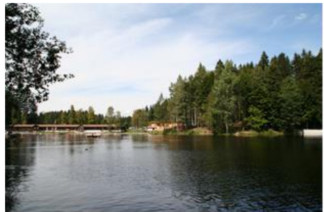
Waldsee mit alter und neuer Badeanstalt