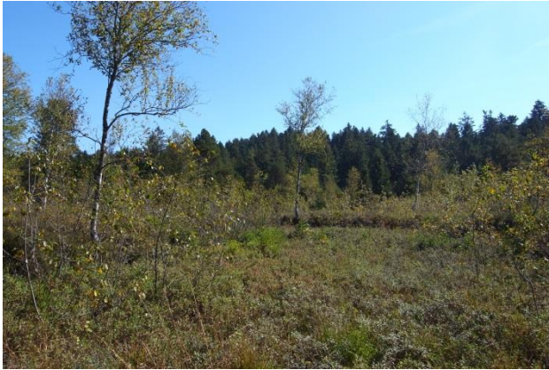
Degradiertes Hochmoor