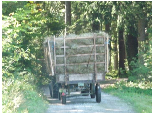
Streuwagen – Herbstmahd

Durch Wiedervernässungsmaßnahmen sollen Moorbereiche renaturiert und der Grundwasserstand im Bereich zu stark entwässerter Flächen wieder angehoben werden.