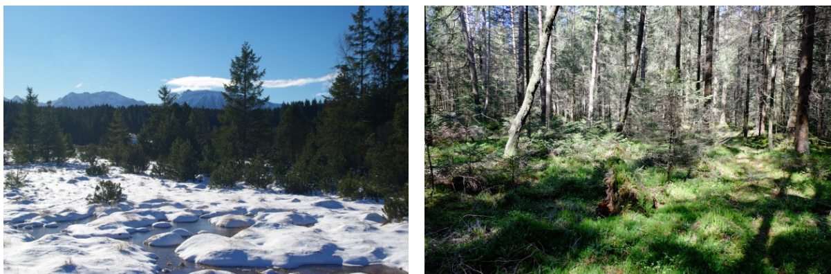
Abb. 4: Spirken-Moorwald (links) und Fichten-Moorwald (rechts)