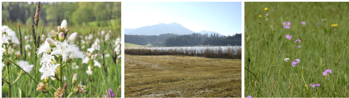
Abb. 3: Fieberklee (links), eine charakteristische Art der Übergangsmoore. Regelmäßig im Herbst gemähtes Kalkreiches Niedermoor nach der Mahd (Mitte). Frühjahrsaspekt mit Mehlprimeln in den östlichen Viehweidteilen.

Pfeifengraswiesen (LRT 6410) wurden auf einer Fläche von 0,6 ha erfasst. Ihr Erhaltungszustand ist wegen der Nutzungsaufgabe mittel bis schlecht (C).