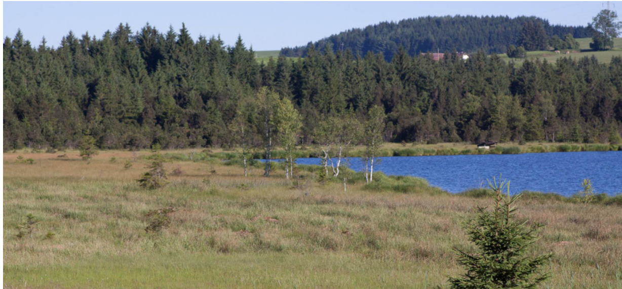
Abb. 1: Attlesee

Runder Tisch zur Managementplan-Bearbeitung am 11.04.2018