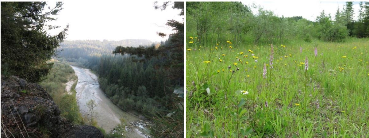
Abb. 4: Blick auf das Halblechtal mit begleitenden Lavendelweiden-Gebüsch (LRT 3240) und orchideenreicher Kalkmagerrasen auf einer Brenne (LRT 6210*).