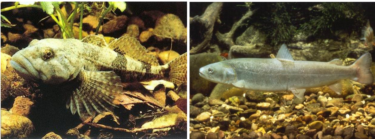
Abb. 8: FFH-Anhang II Arten Groppe (links) und Huchen (rechts) (Fotos: Striegl).

Im FFH-Gebiet sind Vorkommen der beiden Fischarten Groppe (Cottus gobio) und Huchen (Hucho hucho) bekannt. Sie leben in schnell fließenden, klaren und sauerstoffreichen Bächen und Flüssen mit kiesig-steinigem Untergrund. Besonders der Huchen stellt hohe Ansprüche an die Wasser- und Habitatqualität und gilt daher als Zeigerfischart für intakte Bach- und Flussmittelläufe. Er kommt nur in der Donau und einigen ihrer rechtsseitigen Zuflüsse (in Schwaben: Iller, Lech, Wertach und Mindel) vor.