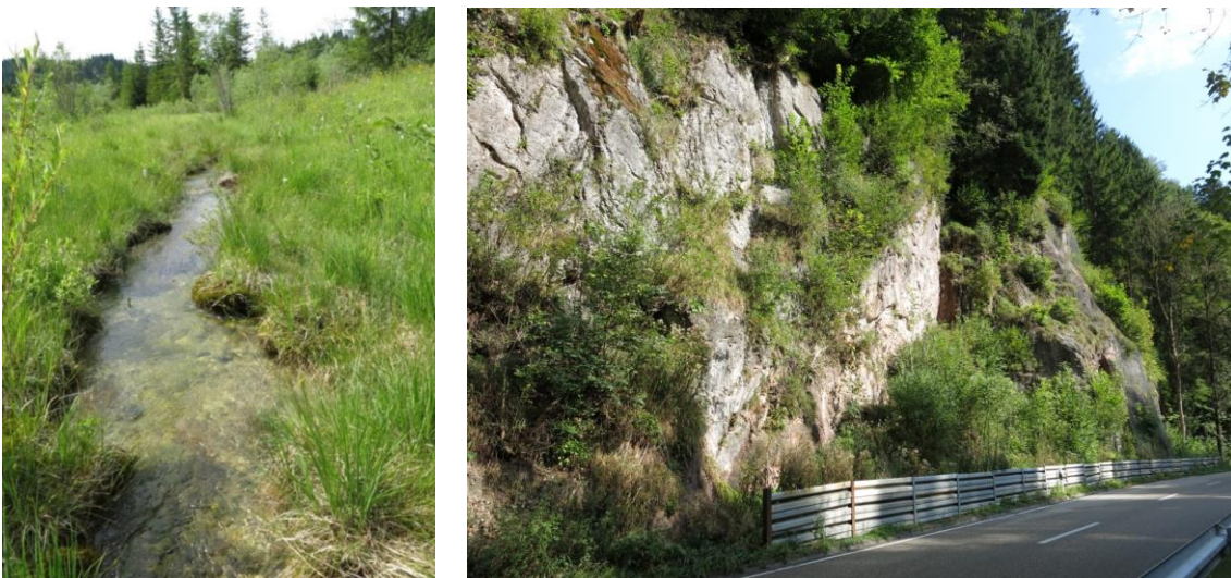
Abb. 5: Von kalkreichem Niedermoor (LRT 7230) begleiteter Quellbach (links) und mit Felsspaltenvegetation und Gehölzen bewachsener Felsen (LRT 8210) zwischen Zwingen und Küchele.