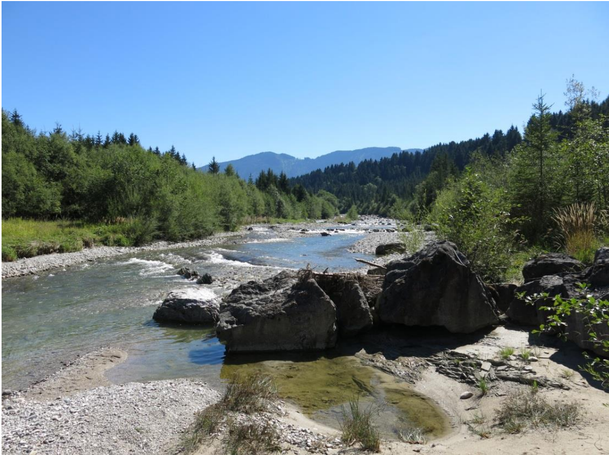
Abb. 1: Der Halblech im "Rappennest".

Runder Tisch zur Managementplan-Bearbeitung am 25.07.2019