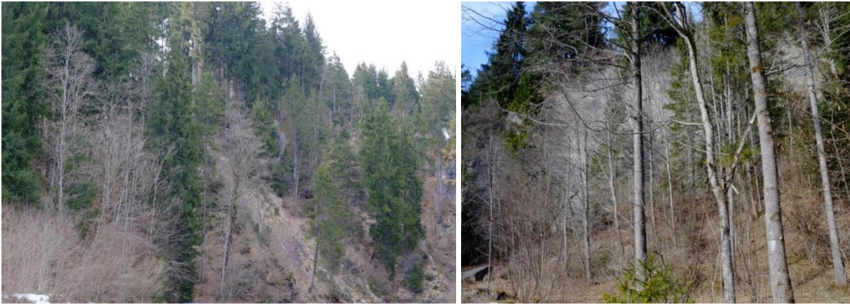
Abb. 6: Waldmeister-Buchenwald (LRT 9130) westlich des Halblechs bei Zwingen und Schlucht und Hangmischwälder als Giersch-Bergahorn-Eschenwald (LRT 9180*) (Fotos: Walter).