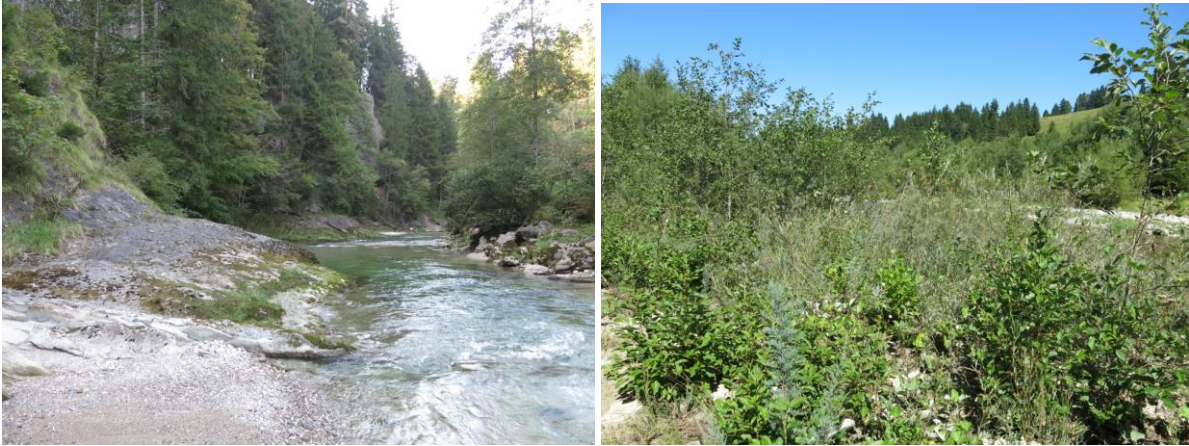
Abb. 3: Halblech mit krautiger Ufervegetation (LRT 3220) und Kalkfelsen südlich Zwingen (links) und Halblech mit Tamariske (LRT 3230).

Sieben weitere Lebensraumtypen wurden während der Bearbeitung im Gebiet festgestellt, wovon vier als signifikant beurteilt und zur Nachmeldung vorgeschlagen wurden. Dazu zählen die Kalktuffquellen, Feuchte Hochstaudenfluren, Borstgrasrasen und Fließgewässer mit flutender Wasservegetation.