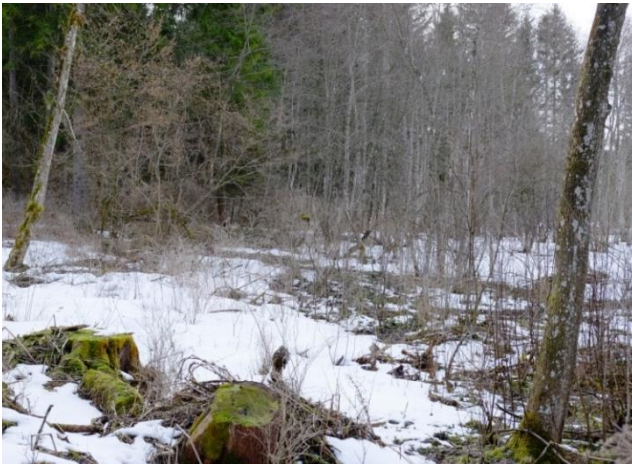
Abb. 7: Erlen-Eschen-Quellrinnenwald (LRT 91E3*).