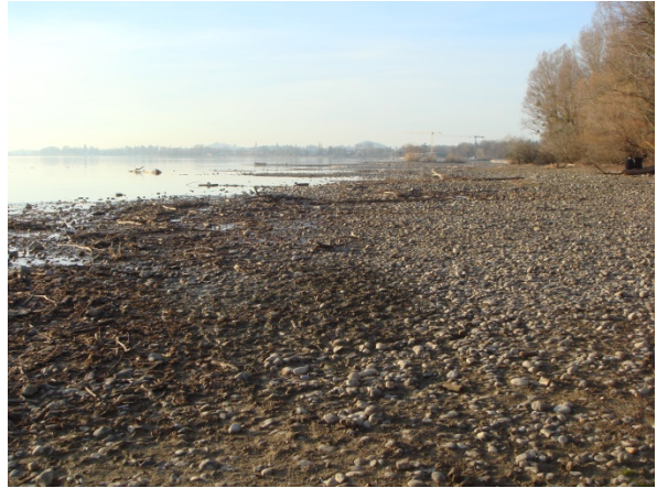
Abb. 5: Mittleres Nixenkraut, eine charakteristische Art der nährstoffreichen Stillgewässer, links (W. v. Brackel). Abb. 6: Bodenseeufer bei Zeh, rechts (Foto: C. Eglseer).