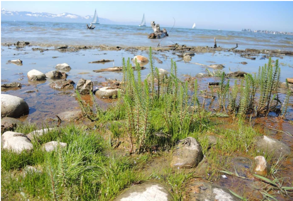
Abb. 1: Strandrasen mit Gewöhnlichem Tannwedel ( Hippuris vulgaris ) am Bodensee-Ufer bei Zech.