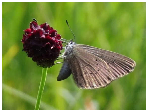
Abb. 9: Groppe, links. Abb. 10: Dunkler Wiesenknopf-Ameisenbläuling, rechts.