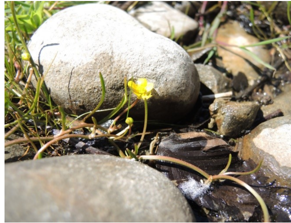
Abb. 7: Bodensee-Vergissmeinnicht, links. Abb. 8: Ufer-Hahnenfuß, ebenfalls eine charakteristische Art der Strandrasen, rechts.