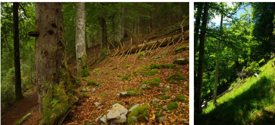
Abb. 7: Waldmeister-Buchenwald (LRT 9130) beim Himmelreich (links), Blaugras-Buchenwald an der Südseite des Kienbergs (LRT 9150), rechts (Fotos: B. Mittermeier).