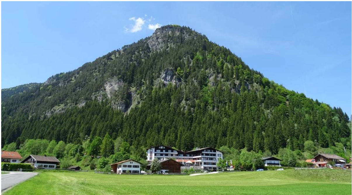
Abb. 1: Blick von Osten auf den Kienberg

Runder Tisch zur Managementplan-Bearbeitung am 06.11.2019