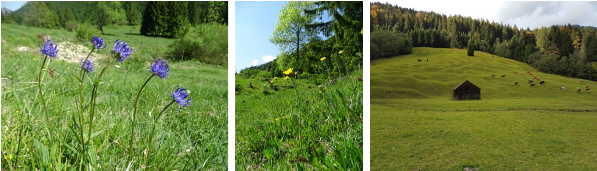
Abb. 3: Kugelige Teufelskralle ( Phyteuma orbiculare ) (links) und Alpen-Pippau im Kalkmagerrasen (LRT 6210) (Mitte), Kalkmagerrasen mit gut sichtbarer Buckelstruktur in Gebietsteilfläche 2 (rechts).

Der dominante LRT sind die Kalkmagerrasen (LRT 6210) , gefolgt von den alpinen Kalkrasen (LRT 6170) und den Berg-Mähwiesen (LRT 6520) .