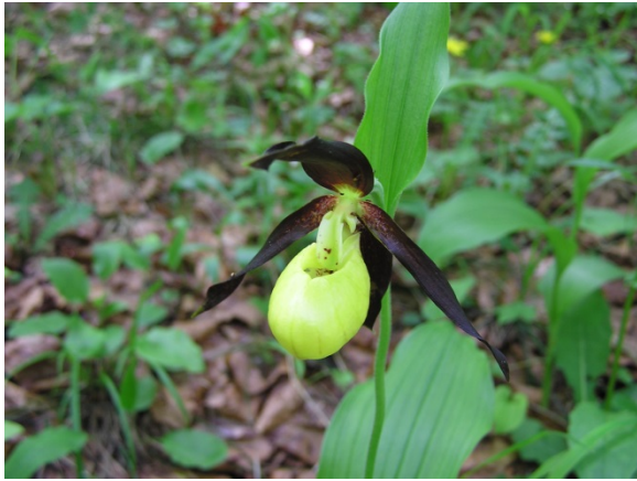
Abb. 9: Frauenschuh nordwestlich des Gasthauses Fallmühle beim Aftental