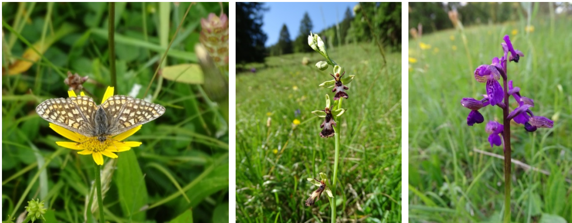
Abb. 10: Skabiosen-Scheckenfalter auf Arnika in den Berg-Mähwiesen (links), Fliegen-Ragwurz zwischen Bren- teneck und Adratsbach (Mitte) und Kleines Knabenkraut im Kalkmagerrasen des prioritären (LRT 6210*) (rechts).