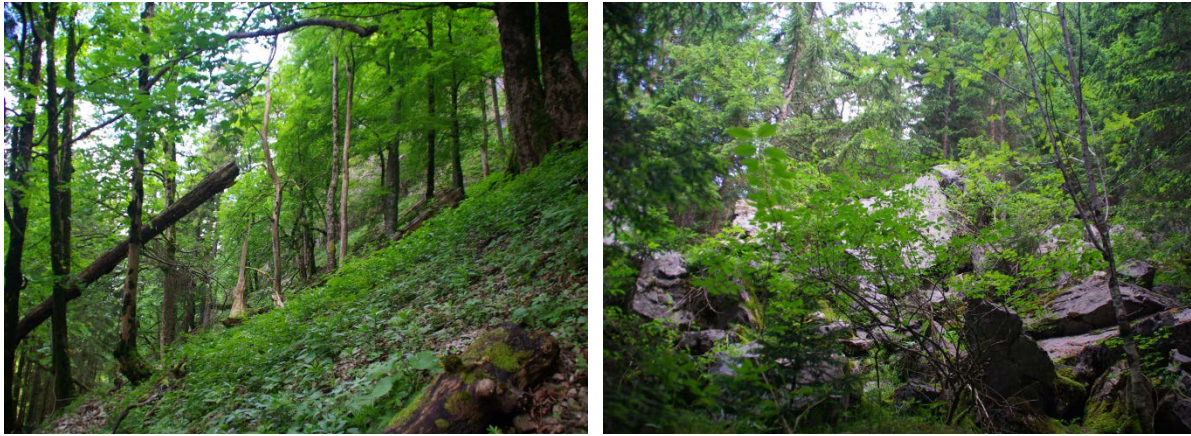
Abb. 8: Schluchtwald (LRT 9180*) an der Nordflanke des Kienberges (links) Carbonat-Blockfichtenwald (LRT 9413) südwestlich des Brentenecks (rechts) (Fotos: A. Walter).

Waldmeister-Buchenwälder (LRT 9130) sind mit ca. 190 ha der am häufigsten vorkommende Lebensraumtyp im Gebiet. Teile davon werden beweidet und bilden eine eigene Bewertungseinheit. Insgesamt ist der Erhaltungszustand günstig.