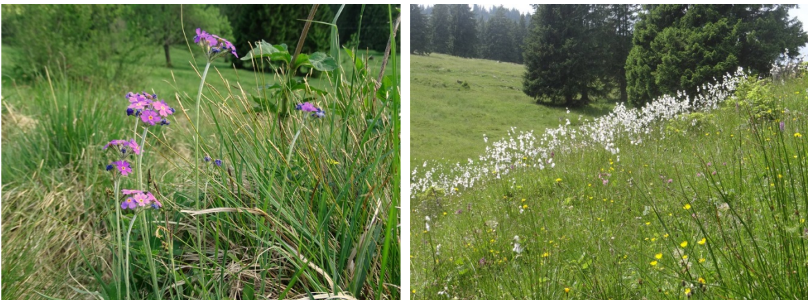
Abb. 5: Mehlprimel und Davallsegge in einem Kalkflachmoor (links), Kalkflachmoor (LRT 7230) auf der Bärenmoos-Alpe im Frühsommer mit fruchtenden Wollgräsern (rechts) (Fotos: AVEGA).