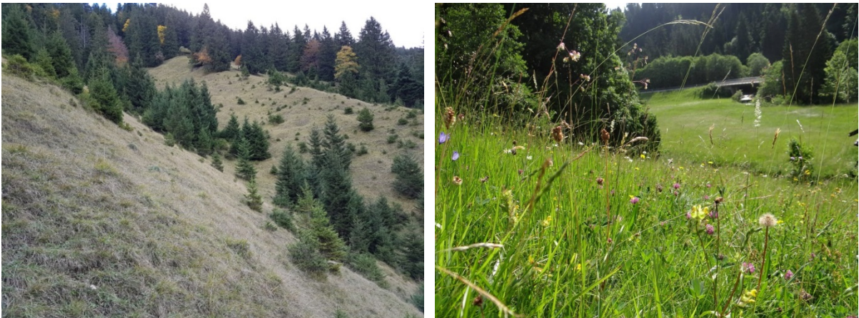
Abb. 4: Verbrachte Kalkmagerrasen und Borstgrasrasen (LRT 6230*) am Brenteneck im Herbst 2017 (links), Goldhaferwiese der trockenen, mageren Ausbildung auf der Schönen Oiben (Bsp. für Berg-Mähwiese (LRT 6520), rechts).