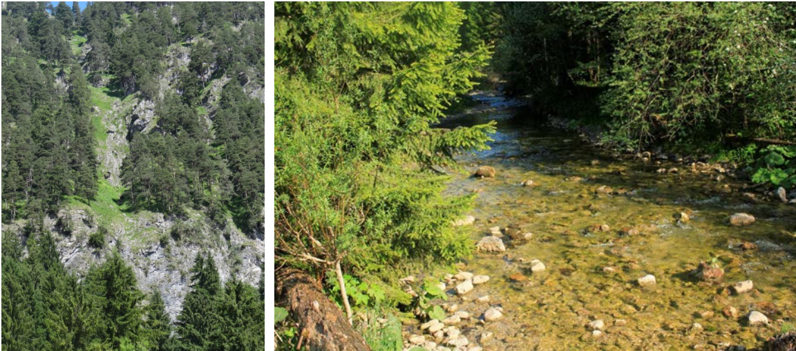
Abb. 6: Charakteristisches Vegetationsmosaik der Kienberg-Südseite aus Schneeheide-Kiefernwäldern, Felsbändern mit Felsfluren (LRT 8210) und alpinen Rasen (LRT 6170) (links), naturnaher Bachlauf der Steinacher Ache ohne LRT-Status (rechts).

Kalkmagerrasen (LRT 6210) stellen am Kienberg mit rund 94 ha und 35 Teilflächen den größten Teil der Offenland-Lebensraumtypen dar. Ihre hohe Artenvielfalt wird neben einer extensiven Bewirtschaftung im Wesentlichen durch die Standortvielfalt auf den Flächen bedingt. Auf 4 Teilflächen gibt es wertgebende Bestände mit bemerkenswerten Orchideenvorkommen ( LRT 6210* ). Diese befinden sich bedingt durch eine lockere Grasschicht und eine hohe Deckung an wertgebenden Kräutern in einem sehr guten Erhaltungszustand.