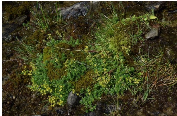
Abb. 4: Rasenbinsen-Hochmoor (LRT 7110*) am Hinterbolgen (links). Alpine Rieselflur (LRT 7240*) mit Fetthennen-Steinbrech ( Saxifraga aizoides ) an der Mitter-Alpe (rechts).

Mit fast 80 ha auf 122 Teilflächen ist der Lebensraumtyp der „ Kalkreichen Niedermoore “ (LRT 7230) mit Abstand am häufigsten im Gebiet vorzufinden. Dies ist auch nicht verwunderlich, zählt die Hörnergruppe doch zu den wichtigsten Moorlandschaften der bayerischen Alpen. Mit zahlreichen seltenen Arten und hohen Anteilen an lebensraumtypischen Kräutern befinden sich etwa 2/3 der Flächen in hervorragendem Erhaltungszustand (A).