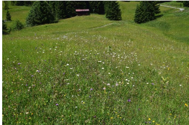
Abb. 3: Die Großblättrige Schafgarbe ( Achillea macrophylla ) ist in Bayern nur im Oberallgäu zu finden. Sie ist hier eine wertgebende Art der alpinen Hochstaudenfluren (LRT 6430). Berg-Mähwiese oberhalb der Wannenkopfhütte. Margeriten- und Wiesen-Flockenblumen-Aspekt. Im Hintergrund Übergang zum Kalkflachmoor (LRT 7230).