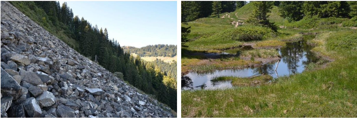
Abb. 7: Fast vegetationsfreie Blockschutthalde (LRT 8120) eines Bergsturzes am Kälberschachen (links). Kolk (LRT 3160) in der Kammvermoorung am Wannenkopf (rechts).

Im Wald wurden vier zusätzliche Lebensraumtypen (mit insgesamt 6 Subtypen) festgestellt, die alle mit signifikanten Anteilen im Gebiet vertreten sind: