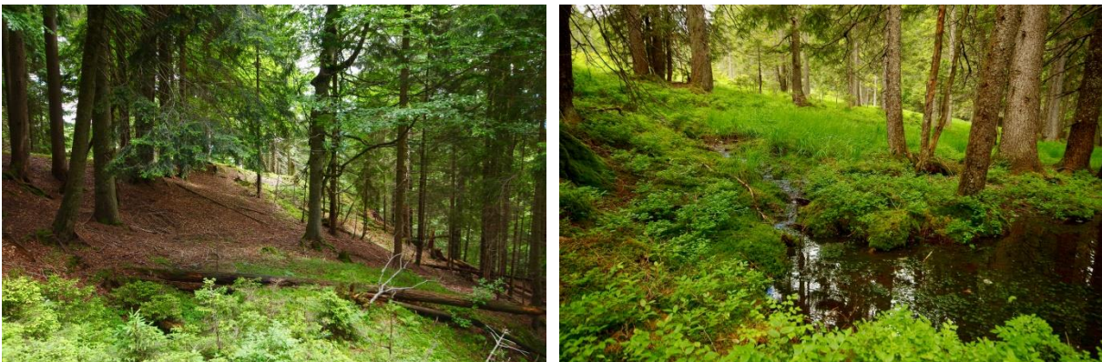
Abb. 8: Montaner Hainsimsen-Buchenwald (LRT 9111) im Bereich Obere Heublat (links). Fichten-Moorwald (LRT 91D4*) am Wannenkopf (rechts).

Montane „ Hainsimsen-Buchenwälder “ (LRT 9111) kommen mit 6,6 Hektar auf sauren Mineralböden im Bereich Vorderbolgen-Heublat vor, während auf den nährstoffreicheren Hanglagen der „ Waldmeister-Buchenwald “ (LRT-Subtyp 9131) sowie besonders der für das Gebiet charakteristische „ Rundblattlabkraut-Tannenwald “ (LRT-Subtyp 9134) zusammen insgesamt 140 Hektar einnehmen. Prioritäre „ Fichten-Moorwälder “ (LRT 91D4) sind mit knapp 4,9 Hektar in den Randzonen der Hochlagenvermoorungen im Bereich Wannenkopf-Bolgen zu finden. Ebenfalls prioritär sind die „ Auwälder “ (LRT 91E0*), die mit den Subtypen „ Winkelseggen-Erlen-Eschenwald “ (91E3*) und „ Grauerlen-Auwald “ (91E7*) auf insgesamt 21,8 Hektar besonders quellige Hanglagen besiedeln.