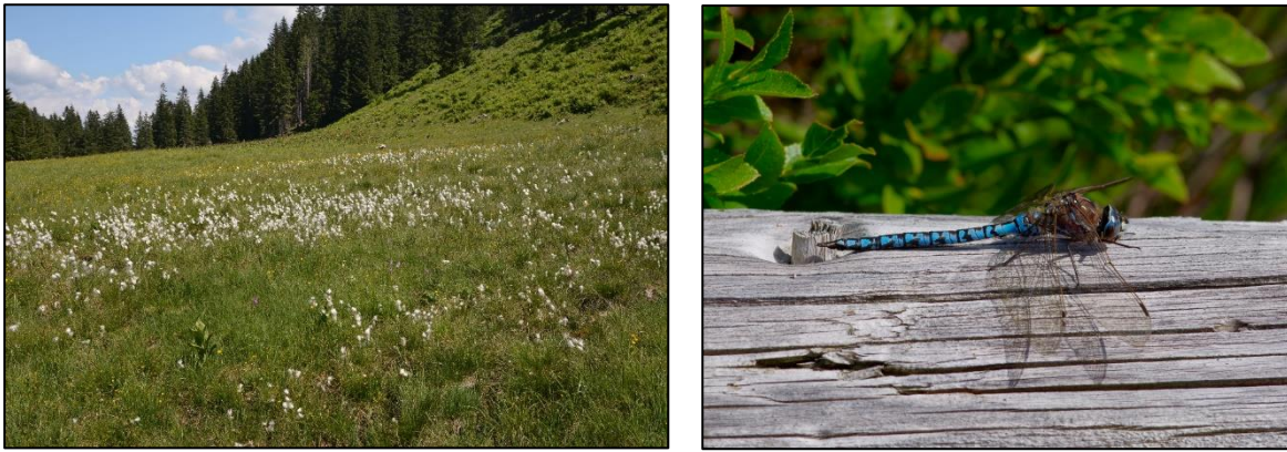
Abb. 11: Beweideter Herzblatt Braunseggensumpf (LRT 7230) im Kontakt mit Lägerfluren (kein LRT) an der Nordseite des Wannenkopfs. Alpen-Mosaikjungfer ( Aeshna caerulea ) am Wannenkopf.