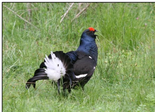
Abb. 10: Wald-Läusekraut ( Pedicularis sylvatica ) an der Ränkalpe. Balzender Birkhahn