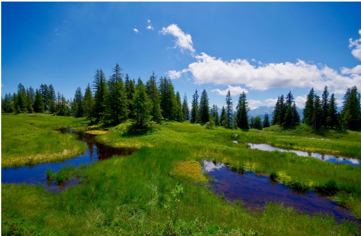
Abb. 1: Hochlagenmoorkomplex am Wannenkopf

Kurzinfo zum Managementplan - Stand Oktober 2020