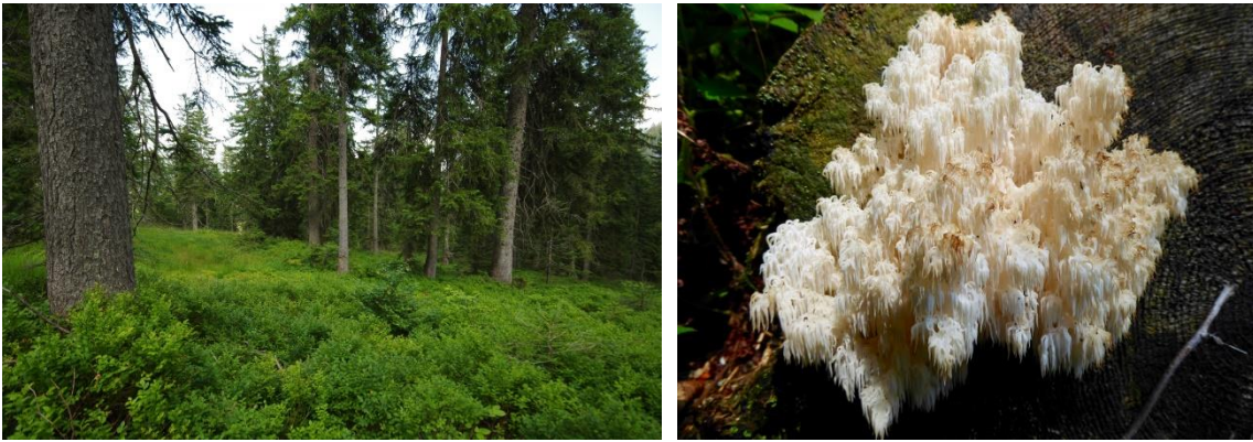
Abb. 6: Subalpine Fichtenwälder sind meist licht aufgebaut und bilden die natürliche Waldgrenze im Gebirge. Auf sauren Böden wie in der Hörnergruppe dominieren Beersträucher wie Heidel- und Preiselbeere. (Foto links: B. Mittermeier). Der filigrane Tannen-Stachelbart ( Hericium flagellum ) kommt auf starkem Tannen-Totholz vor und gilt als Zeiger naturnaher Wälder (Foto rechts: B. Mittermeier).

Mit 4 Teilflächen und insgesamt 3,92 Hektar ist der Lebensraumtyp „ Subalpiner Buchenwald mit Ahorn “ (LRT 9140) nur mit kleinen Flächen und ausschließlich im Bereich des Prinschenkessels im Gebiet vertreten. Er besiedelt lehmige Böden in schneereichen Kessellagen und wird überwiegend von Laubhölzern wie Buche und Bergahorn geprägt. Auf Sukzessionsflächen ehemaliger Alpfelder treten dagegen Pioniere wie Grünerle, Großblättrige Weide oder Vogelbeere in den Vordergrund. Der Lebensraumtyp befindet sich aktuell in gutem Erhaltungszustand (B).