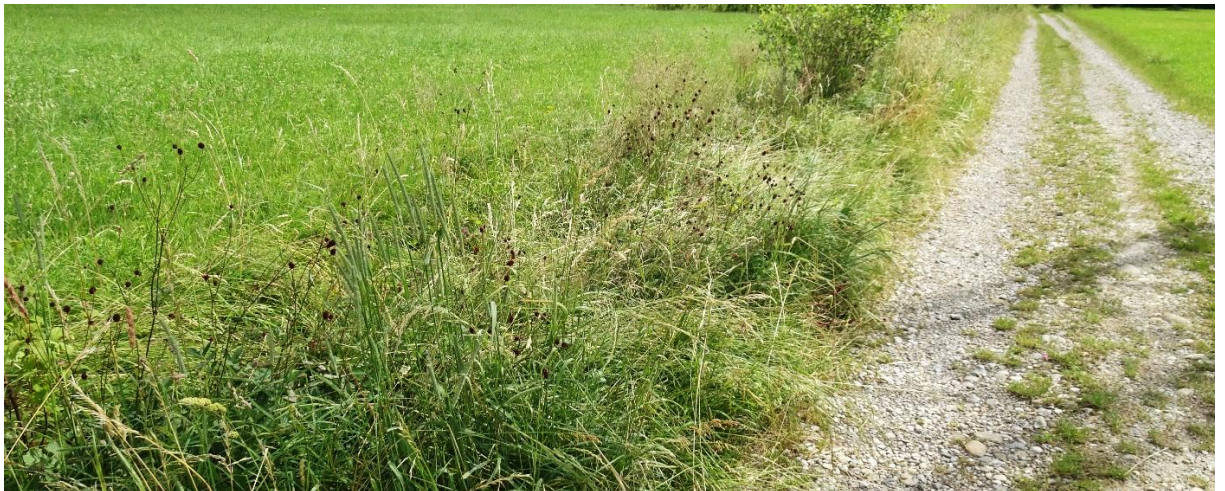
Abbildung 1: Abbildung der Grabenstruktur mit Sanguisorba officinalis (06/2021)

Ein Vorkommen des Falters im Bereich der Grabenstruktur von Mast 6 scheint potenziell möglich. Einzelindividuen konnten bei der Begehung nicht festgestellt werden. Weitere Informationen zur lokalen Population liegen nicht vor. Der Zustand der lokalen Population wird vorsorglich mit „mittel – schlecht“ eingestuft.