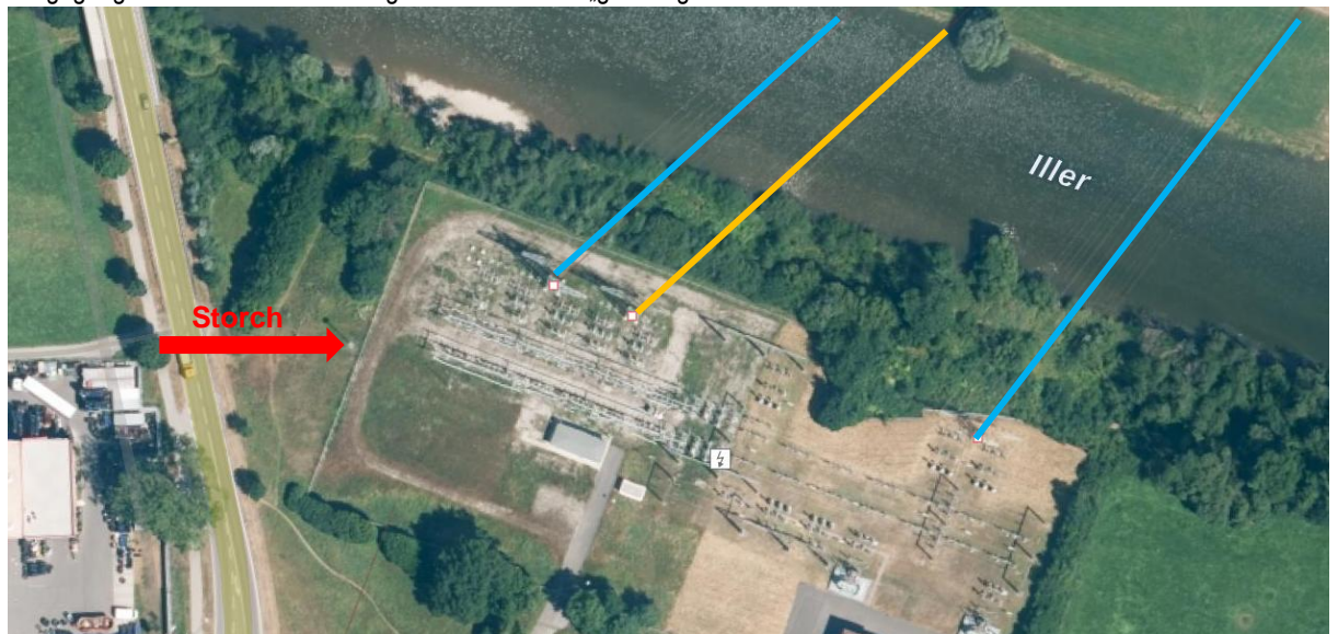
Abbildung 2: Lage des Storchennests; plangegenständliche Trasse (orange)

Angrenzend zum Umspannwerk Krugzell findet sich ein regelmäßig besetztes Storchennest. Aufgrund der steigenden Populationen in den letzten Jahren in Bayern kann grundsätzlich von einem guten Erhaltungszustand der lokalen Population ausgegangen werden. Der Erhaltungszustand wird als „gut“ eingestuft.