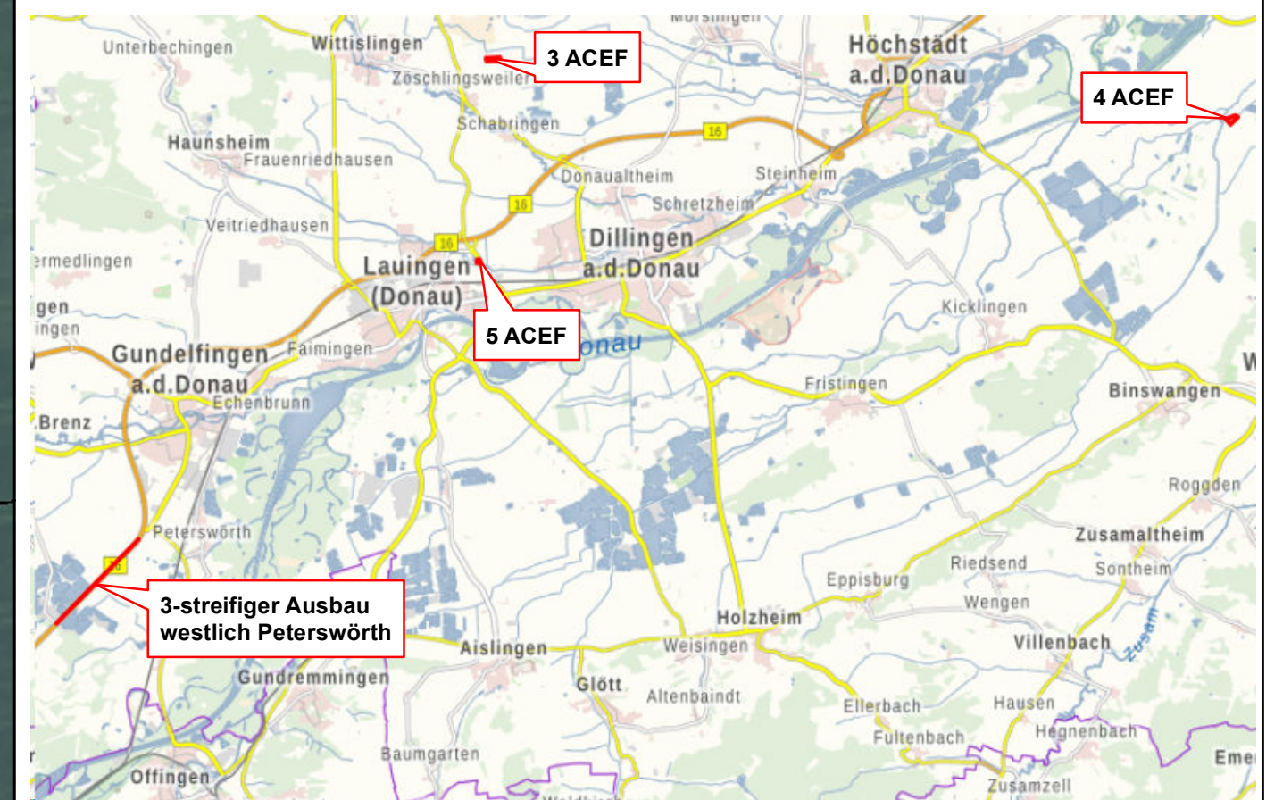
Übersichtslageplan (Darstellung unmaßstäblich)