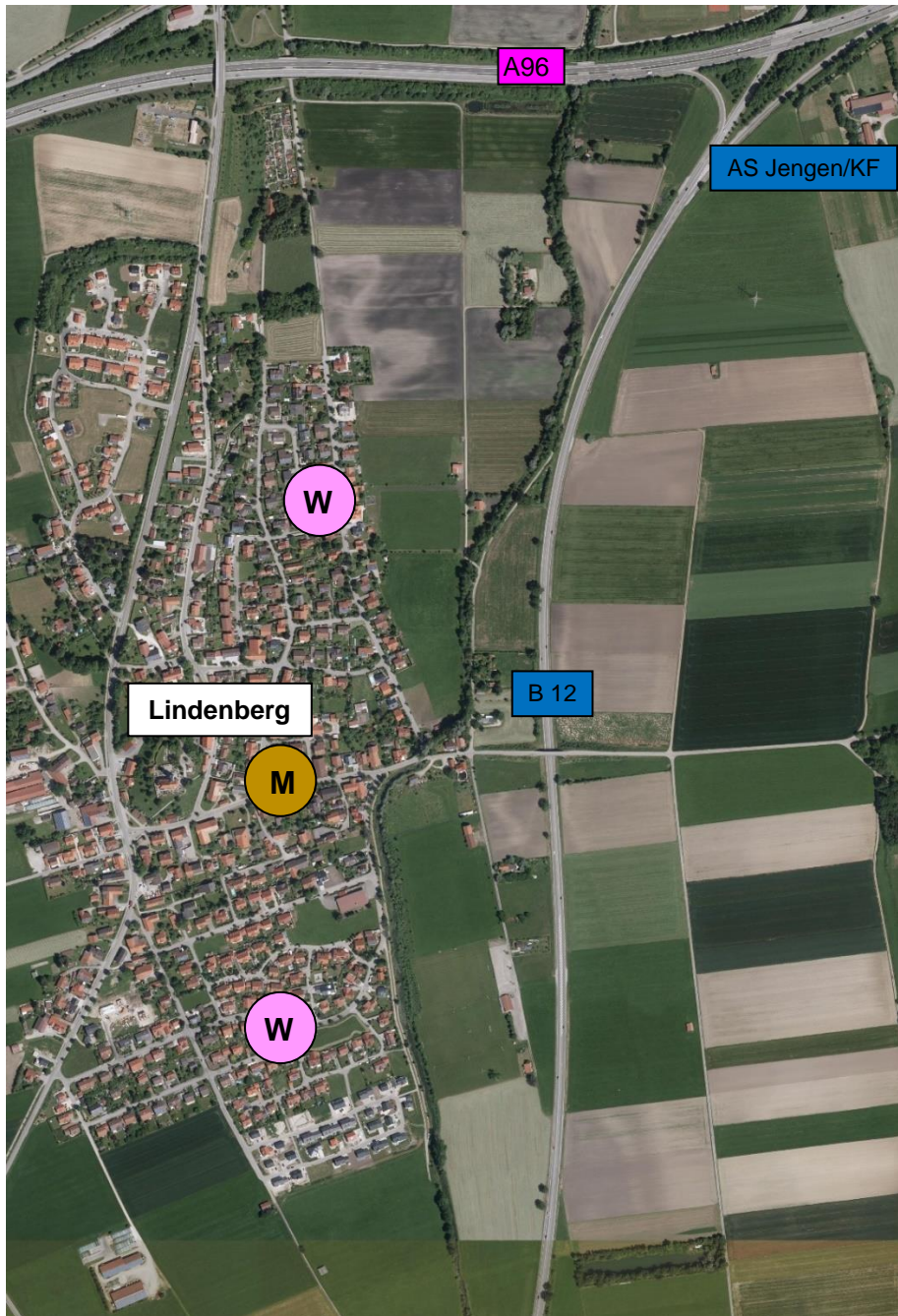
Abbildung 1: Wohn- und Mischgebiete von Lindenberg mit B 12 und BAB 96 (Bestand)