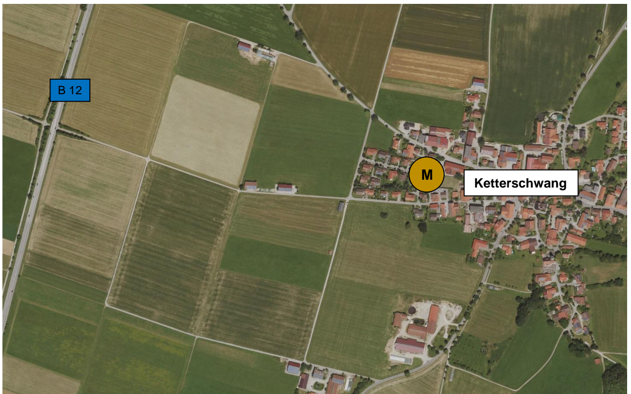
Abbildung 4: Dorfgebiet von Ketterschwang mit B 12 (Bestand)