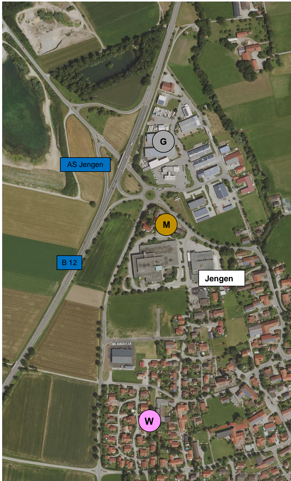
Abbildung 2: Wohn-, Misch-, Gewerbegebiete sowie Außenbereiche von Jengen mit B 12 (Bestand)