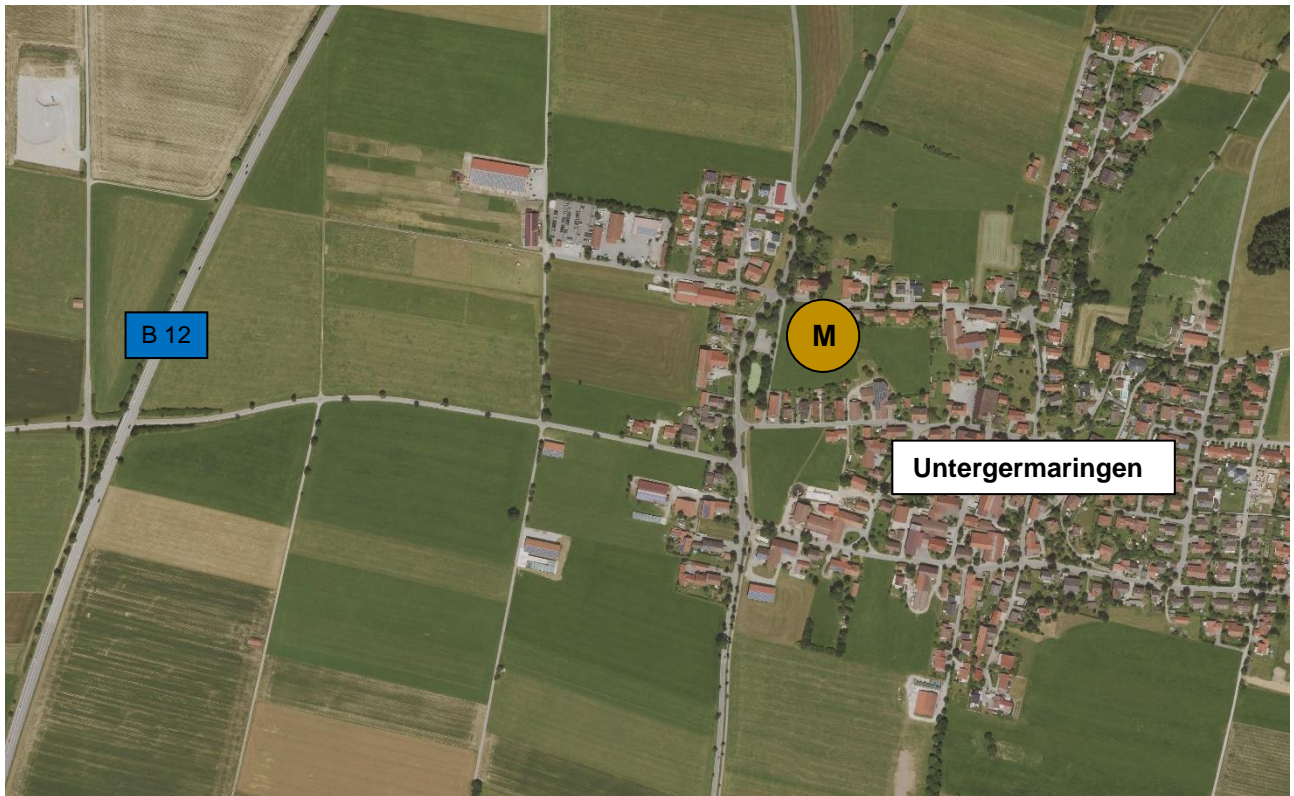
Abbildung 5: Dorfgebiet von Untergermaringen mit B 12 (Bestand)

Die Verkehrsverhältnisse machen im vorliegenden Abschnitt den vierstreifigen Ausbau auf einer Länge von ca. 10,2 km erforderlich.