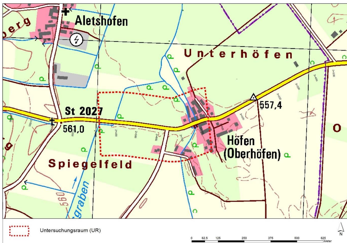
Abb. 1: Abgrenzung des Planungsgebietes