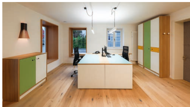
Bildnachweis: Schwarzplan: Jakob Architekten, Krumbach.