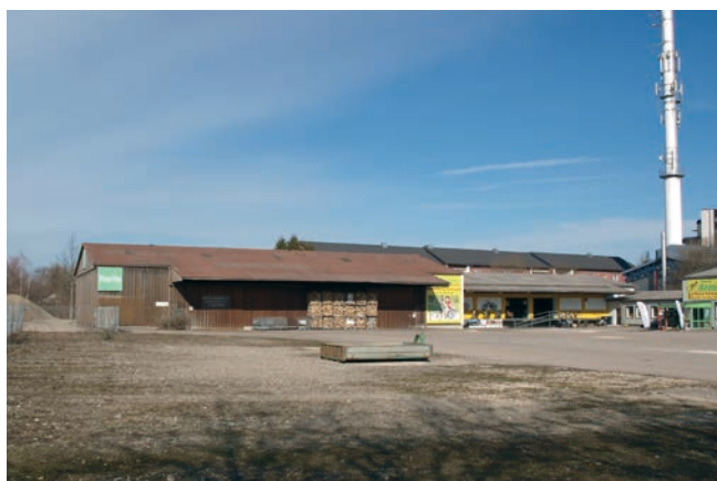
Bildnachweis: Plane: Wick & Partner / g2; Foto: Regierung von Schwaben